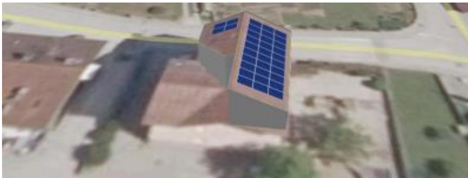
Situacija umestitve sončnih panelov na objekt